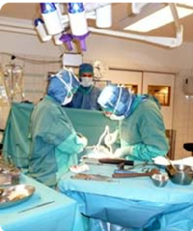
Operatörens registrering i Swespine är det som ger täckningsgrad.